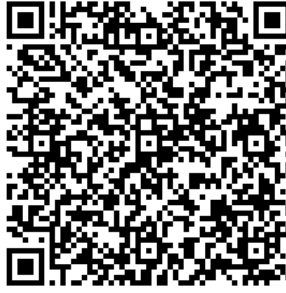
Рисунок 7 — Сценарий тематической викторины с примерами вопросов

В каждом из перечисленных мероприятий важно отслеживать активность участников, высказываемыми ими мнения, их настрой в целом. На таких мероприятиях необходимо присутствие психолога для фиксации активности и оценки их поведения.